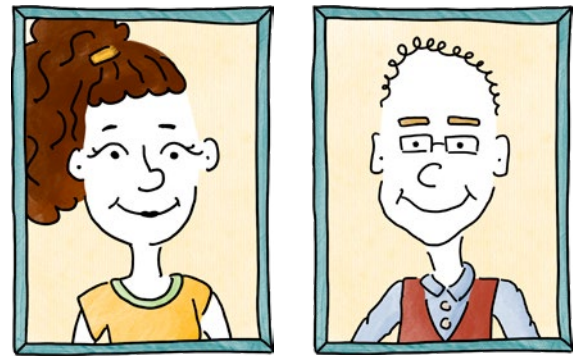
Illustrationen © Martha Herbold / ZQS

Wie das Programm richtet sich der Kurs vorrangig an Lehramtstudierende aller Fachrichtungen, doch auch Lehrende der LUH können das Angebot nutzen, da sich die Inhalte leicht auf die universitäre Lehre übertragen lassen. Dies zeigte auch ein erfolgreicher Test mit positivem Feedback auf der Tagung der Deutsche Gesellschaft für Hochschuldidaktik (dghd). Mitgeschrieben haben neben den Projektleitenden auch studentische Mitarbeiter*innen.